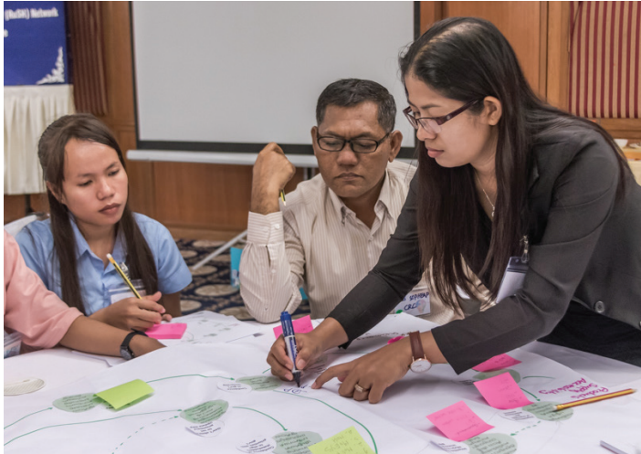
អ្នកចូលរួមជាង 100 នាក់មកពីវិស័យ RuSH បានចូលរួមក្នុងពិធីសិក្ខាសាលា នេះ ដើម្បីពិភាក្សាអំពីការរកឃើញនៃបណ្តាញរៀបចំការវិភាគ។

បន្ទាប់ពីការវិភាគលទ្ធផលបឋម ក្រុមការងារលីង (LINC) និង អង្គការវិតធើសេដ បានធ្វើសិក្ខាសាលាពិគ្រោះយោបល់មួយ ដែល មានការចូលរួមពីអ្នកពាក់ព័ន្ធ ប្រមាណជាង ១០០ នាក់ នៅក្នុងវិស័យ អនាម័យជនបទ ដើម្បីបង្ហាញ និងឲ្យអ្នកចូលរួមទាំងអស់ពិភាក្សាទៅ លើលទ្ធផល។ សិក្ខាសាលានេះ ក៏ដើម្បីប្រមូលនូវមតិយោបល់ដំបូង ដើម្បីបញ្ចូលទៅក្នុងការវិភាគ។